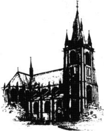
St. Bonifatius, Fulda-Horas